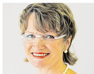
Monika Kürzeder

Terminvereinbarung unter Telefon (08234) 9983144. Statt regulärer Öffnungszeiten wird jeder Kunde bei einem individuellen Termin beraten: ungestört, ohne Zeitdruck und unter Einhaltung strengster Hygienemaßnahmen.